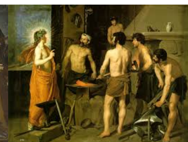
La fragua de Vulcano